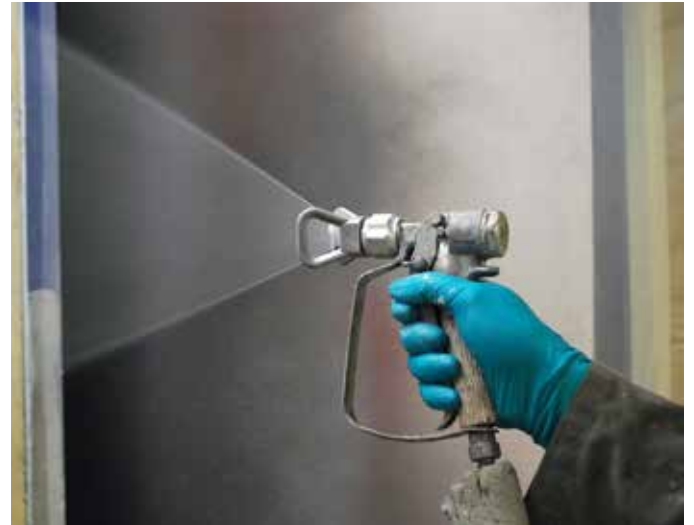
Belzona 1381 permite aplicaciones con pulverizador con un desgaste insignificante de la boquilla.

Con Belzona 1381 se pueden aplicar grandes espesores (> 1250 micrones) en una sola capa sin descuelgue.