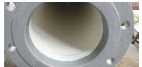
Antes, durante y después de una aplicación de Belzona 1381 mediante pulverizador en el interior de una tubería.

Si necesita más información, comuníquese con el representante de Belzona de su localidad: